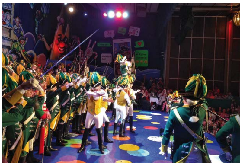
Abb. 4: Abendveranstaltung des Symposiums: Teilnahme an einer Karnevalsitzung der Ehrengarde der Stadt Köln.

Alle Teilnehmer/-innen mussten sich anschließend sehr beeilen, um rechtzeitig der Abendveranstaltung – die Sitzung der Ehrengarde der Stadt Köln im Gürzenich – in Abendgarderobe beizuwohnen, wo das Symposium einen unterhaltsamen Ausklang fand.